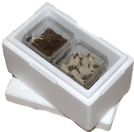
Styroporbox 4,71 (33 x 20 x 18,5 cm Aussenmaß)