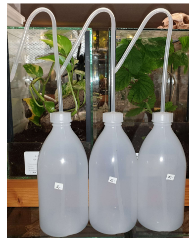
Spritzflaschen 500 ml Stück 5 €