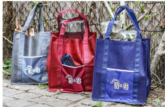
Einkaufstaschen W&S für 2,50 €

Edelstahlpinzette 25,5 cm gerade oder gebogen 9 €