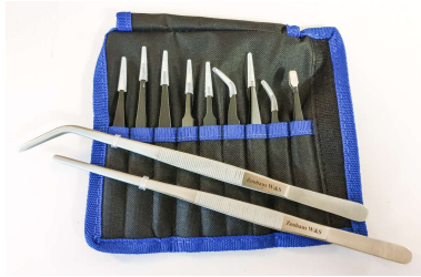
Pinzettenset für Feinarbeiten 9-teilig.